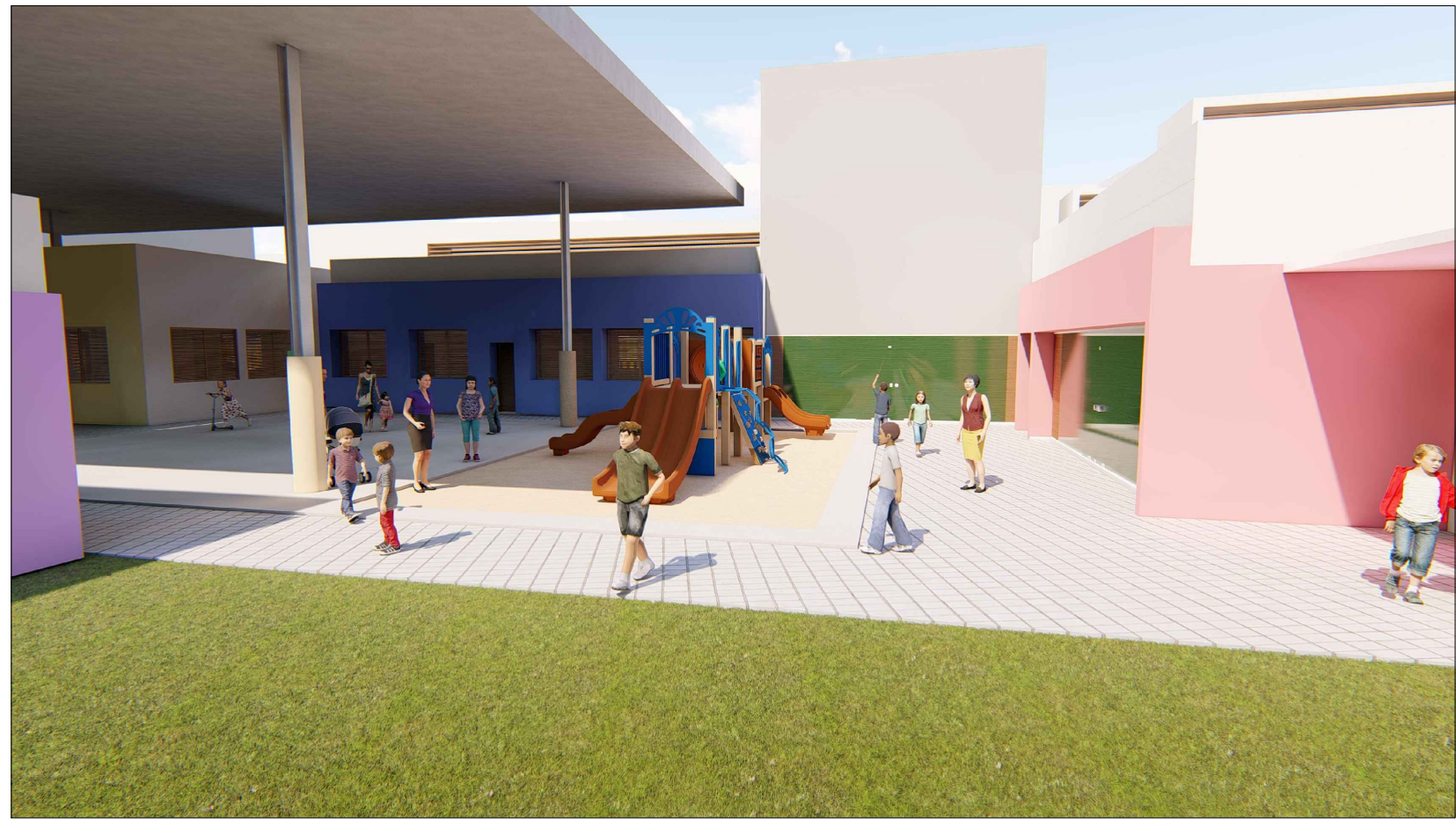
Pátio central proposto com a finalidade de ter um maior contacto entre todos os alunos independentemente da idade dos mesmos.

Observa-se que os enquadramentos nas fachadas geram uma proporção equilibrada entre cheios e vazios. Em vários pontos há níveis de visibilidade entre interior e exterior, criando conectividade entre ambos.